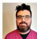
T.M. Eduardo Urrea Oftalmología y Optometría